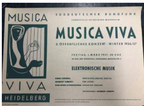
Musica-viva-Konzert 1. März 1957