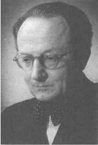
Links: Der Komponist Wolfgang Fortner (1907–1987)