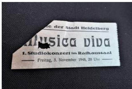
Eintrittskarte zum ersten musica-viva-Studiokonzert am 5. November 1948

Nur eine blassgraue Eintrittskarte vom 5. November 1948 ist erhalten, dazu ein Zettel mit dem Programm des ersten musica-viva-Studiokonzerts im Rathaussaal, zwei Kompositionen von Paul Hindemith. „Die junge Magd“ für Alt, Flöte, Klarinette und Streichquartett nach Gedichten von Georg Trakl sowie die Kammermusik Nr. 1 op. 24. Den Heidelberger Ohren werden allein schon mit der Instrumentierung bislang unerhörte Klänge präsentiert: ein Bläserquartett und ein Streichquartett kombiniert mit Klavier, dazu Akkordeon, eine Sirene, eine mit Sand gefüllte Blechbüchse sowie andere nicht ganz salonfähige Instrumente.