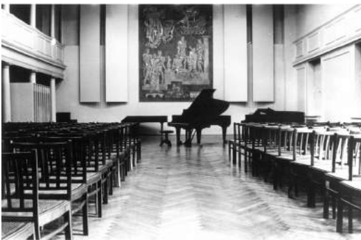
Sendesaal der Sendestelle Heidelberg des SDR 1949

Bei den Konzertkritiken beeindruckt, auf welchem hohem Niveau das lokale und später nationale Feuilleton die Reihe begleitet. Denn auch für Journalisten war das erst einmal ungewohntes Terrain, sie mussten sich kundig machen, um kompetent und sachlich über zeitgenössische Musik aufzuklären, um Eigenheiten und Absichten verständlich zu erklären und um den künstlerischen Wert eines Konzertabends meynungsstark einzuordnen. Nicht auszuschließen, dass diese besondere Art von wohlformulierter Musikpädagogik zum Erfolg der Reihe maßgeblich beigetragen hat. Wolfgang Fortner hatte den Aspekt der musikalischen Erziehung beziehungsweise Geschmacksbildung ebenfalls im Blick. In einem Grundsatztext notiert er: